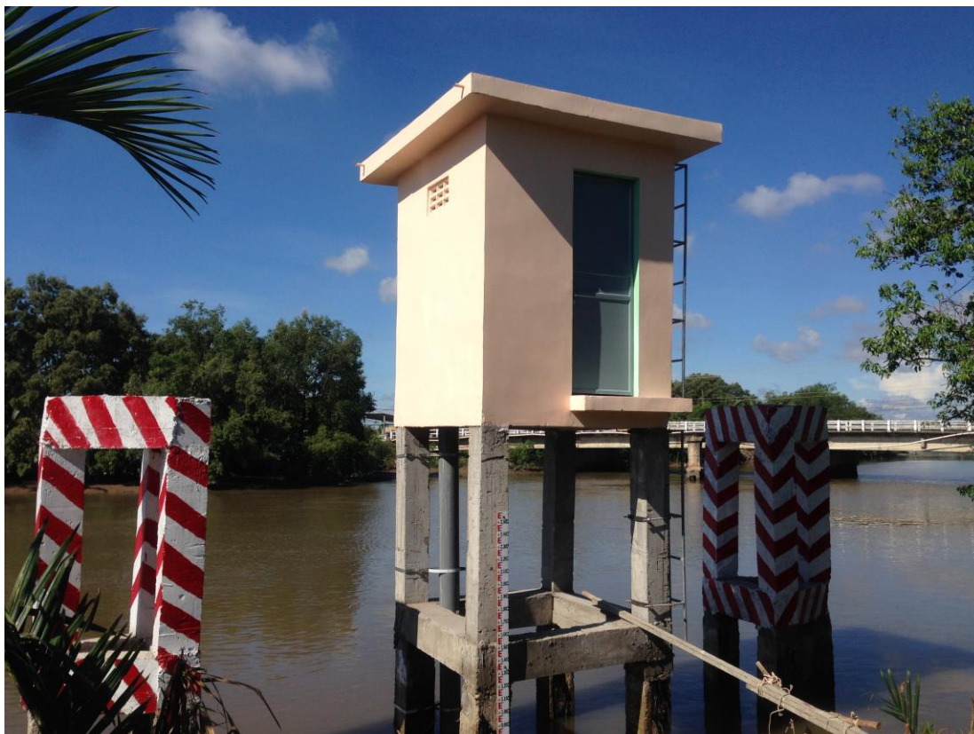
Hình bên ngoài nhà trạm