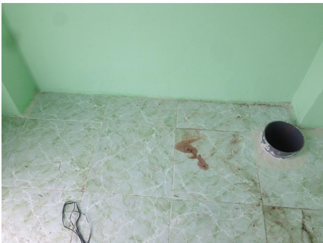
Hình sàn bên trong nhà trạm