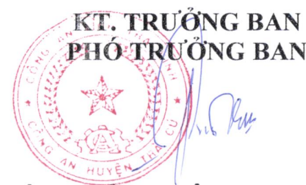
PHÓ TRƯỞNG CÔNG AN HUYỆN Thượng tá Thạch Nào